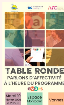
Table Ronde rassemblant des intervenants en EARS, de la Pastorale Familiale, de l'Enseignement Catholique du Morbihan et des AFC.

« Parlons d'affectivité à l'heure du programme EVARS »