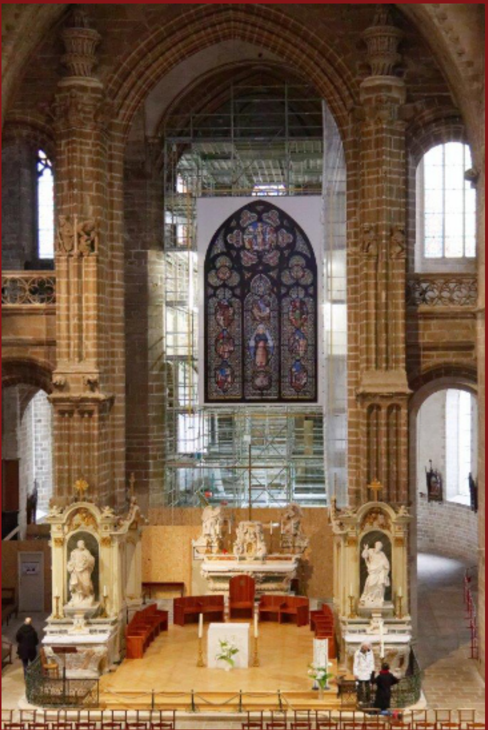
Cathédrale Saint-Pierre en travaux